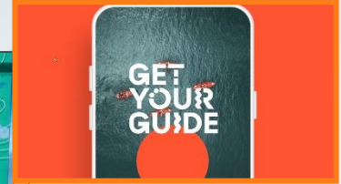
19:21:28 Uhr Sponsor Outro

Exklusivität, unverwechselbarer Auftritt mit positivem Imagetransfer