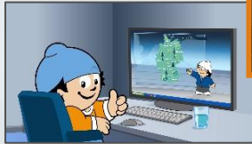
19:20:12 Uhr Mainzelmännchen