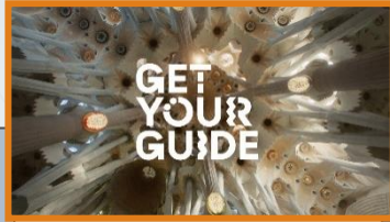
19:20:15 Uhr Sponsor Intro